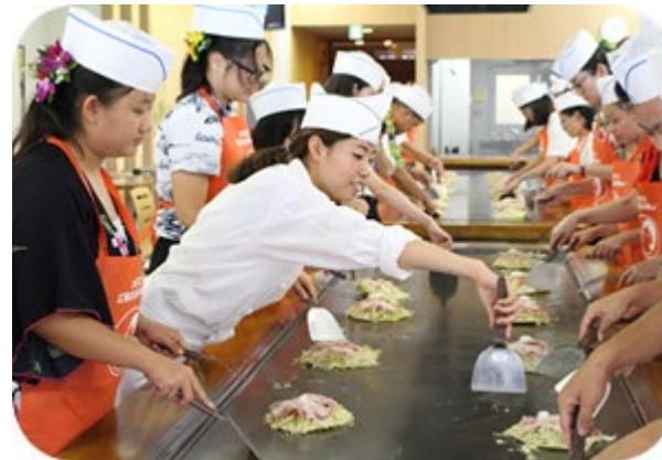
<お好み焼づくり体験>

広島県の代表的な食であるお好み焼の発展に寄与し、日本のみならず世界に向けて積極的にその歴史や文化を発信していることが高く評価された。展示の内容もお好み焼を通して、広島戦後復興に触れるなど、他事業者の模範となる施設型の産業観光モデルとなっている。また、インバウンドの受入姿勢も評価のポイントとなっている。