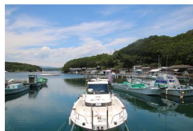
英虞湾内の入り江

志摩市総合計画ならびに志摩市観光振興計画では、豊かな食文化や伊勢志摩国立公園の美しい自然だけでなく、真珠養殖や海女漁といった水産業をはじめとする人と自然の共生から生まれる産業を、貴重な観光資源であると位置づけ、観光業と地場産業の振興を一体のものとして捉えた「里海ツーリズム」を推進している。また志摩市は、2018年6月に持続可能な開発目標(SDGs)達成に向けた取り組みを先導的に進める自治体「SDGs未来都市」に選定され、「志摩市SDGs未来都市計画」を策定し、伊勢志摩国立公園の豊かな自然環境や伝統文化と市民の暮らしが調和した持続可能なまちづくりを進めている。さらに、2019年6月25日には、志摩市と近鉄グループホールディングス株式会社で「志摩MaaSに係る連携協定」を締結し、同年度中にMaaSに係る実証実験を実施予定である。