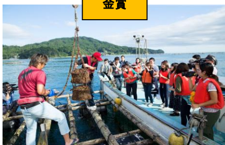
海中熟成酒の設置/水揚げ体験