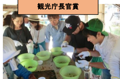
真珠取り出し体験