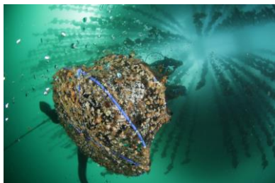
海中熟成酒引き上げの様子

広田湾遊漁船組合は遊漁船資格を有する漁師からなる組織で、2014年4月より広田湾の海産物をはじめ、陸前高田市の様々な地域資源のPRを目的として漁業体験や情報発信、加工品開発を行っている。2017年11月に立ち上げられた「広田湾海中熟成プロジェクト」では、日本唯一の常時提供可能な海中熟成の体験型観光サービスを行なっている。地元の漁師の間では昔から、「海に酒を沈めると美味しくなる」「船の上に水を置くと腐らない」という話もあり、海中熟成に着手することとなった。