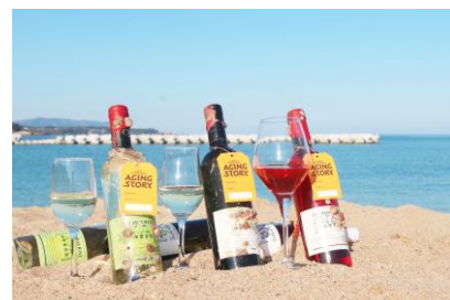
広田湾と海中熟成ワイン

この海中熟成体験プログラムを通しての狙いは、体験を目的に市内に観光客が訪れることで、市内周遊、滞在が生まれ、波及効果が創出されることにある。さらに他地域のお酒やジュースなどの海中熟成を行うことで、市外地域との連携も図っており、将来的には地域間連携による産業の相互活性化を目指している。