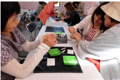
オリジナルアクセサリー作り体験風景

真珠養殖発祥の地である英虞湾を有する志摩市では、海に関する様々な体験プログラムを提供している。その中でも、世界に誇れる真珠というキラコンテツを活かした「真珠取り出し体験」および「オリジナル真珠アクセサリー作り体験」は人気が高く、年間1万人を超える参加者がある。「真珠取り出し体験」では、養殖されている生きたアコヤ貝から、本真珠を取り出し、「オリジナル真珠アクセサリー作り体験」では真珠に穴あけなどの加工を行い、製品化の工程を体験することができる。真珠養殖発祥の地という歴史を伝えるだけでなく、真珠養殖筏が浮かぶ複雑に入り組んだ美しい英虞湾の風景を眺めながら、受け継がれてきた技術、真珠養殖、加工の過程を疑似体験できる総合的な体験学習プログラムとなっている。取り出し体験を提供する施設は、志摩市内においても交通アクセスが非常に不便な地域に位置しているにも関わらず人気を博しており、当該地域への観光客の周遊性を高め、周辺の飲食店、宿泊施設等への誘客や定期船、路線バス、タクシーといった公共交通機関の利用者増加にも大きく貢献している。