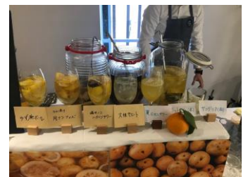
提供された飲み物

gomi_pit BAR は、都心にいながら環境を学び、楽しむ観光的要素を盛り込んだ都市型エコツーリズムとして、また、ごみ処理場という環境インフラを活用したインフラツーリズムとして位置付けられている。武蔵野クリーンセンターでは今後、環境啓発施設「エコプラザ(仮称)」と「芝生広場」・「どんぐり広場」を2020年秋までに敷地内にオープンする予定である。