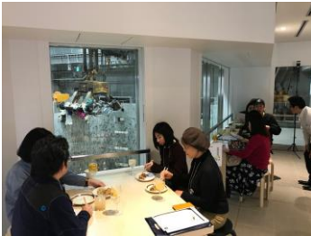
バーでの食事風景

武蔵野市唯一のごみ処理施設である「武蔵野クリーンセンター」は建設地から施設の仕様まで、市民参加による議論を経て建設した施設である。初代施設の老朽化に伴い、同敷地内に建替えを行い、現在のセンターが2017年から本稼働している。新しいクリーンセンターは、武蔵野の雑木林をイメージした外観デザインが街並みと調和し、ごみ処理の流れを自由に見学・体感できる市民に開かれた施設となっており、2017年にグッドデザイン賞を受賞している。市内小学校の郊外学習や国内外からの視察団の受け入れを中心に、さらに「エコマルシェ」などのイベントも定期的で開催され、徐々に認知度は上がりつつある。