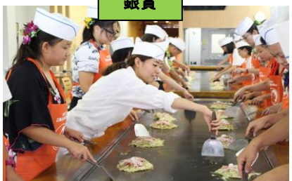
お好み焼づくり体験