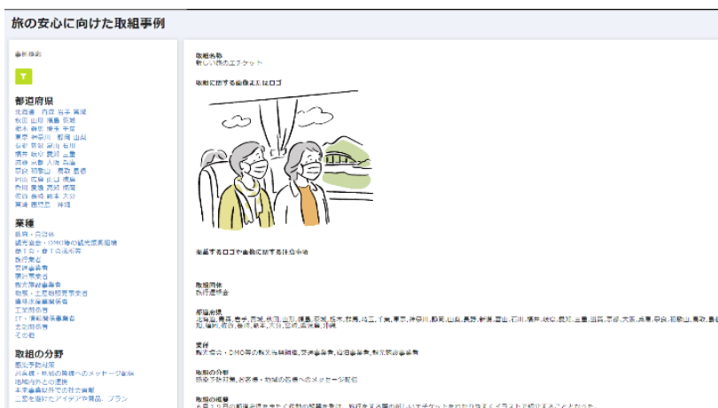
(個別事例ページ・イメージ)