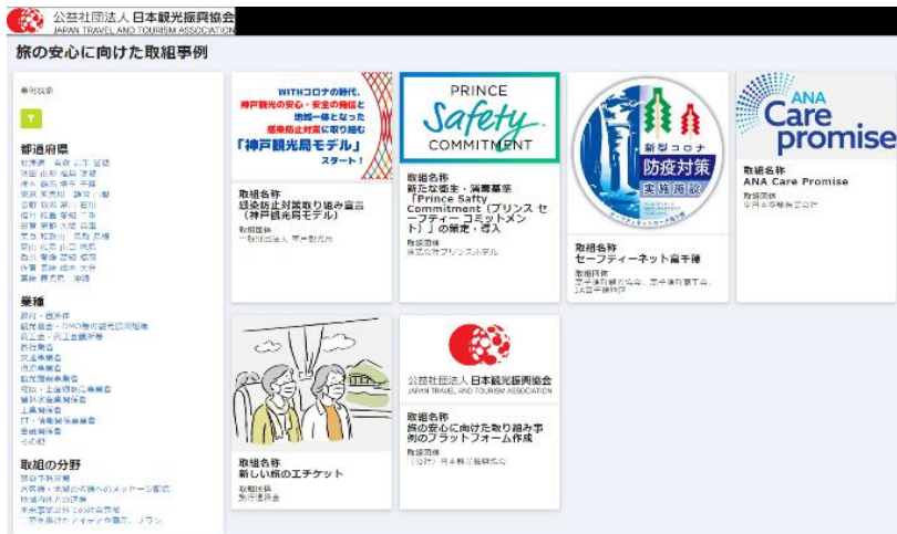
(取組一覧ページ・イメージ)

観光関連団体・企業の皆様におかれましては、旅行の安全・安心の確保に向けた取組へのご登録をお願いいたします（情報の登録は無料です）。ご登録に関するお手続きについては、別紙2をご参照下さい。