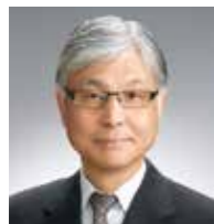
委員長 本保 芳明 国連世界観光機関(UNWTO) 駐日事務所代表