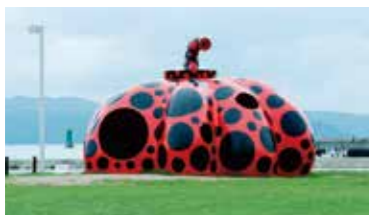
草間彌生「赤かぼちゃ」2006年 直島・宮浦港緑地