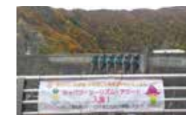
受賞ロゴが入った横断幕(湯田ダム)