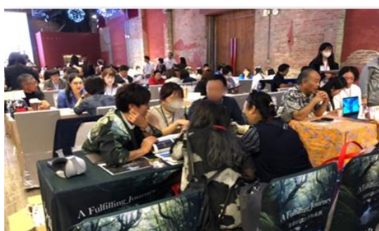
2023 年の商談会の様子