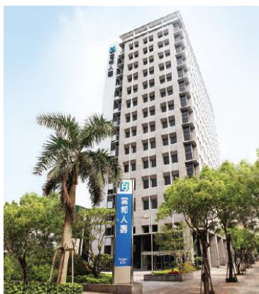
商談会会場の外観