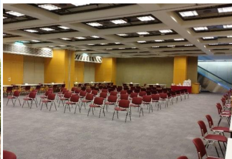
商談会会場の内観