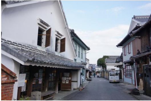
肥前浜宿のまちなみ