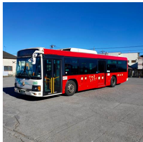
シウマイ餃子ラインラッピングバス