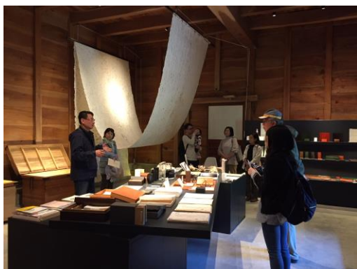
越前和紙産地のまち歩きツアー（杉原商店）