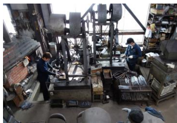
越前打刃物工場の作業風景 (タケフナイブピレッジ)