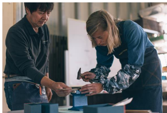
越前打刃物工房の製作体験（龍泉刃物）

また、タクシー事業者 5 社と連携し、点在する工房や市内の観光施設等をつなぎ、定額 500 円で利用可能なサービスを通年で実施するなど、来訪者の利便性をかなえるための取組も行っている。