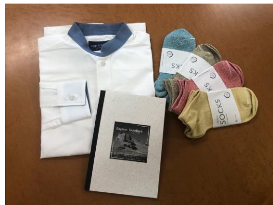
商品開発したバガス素材のアイテム