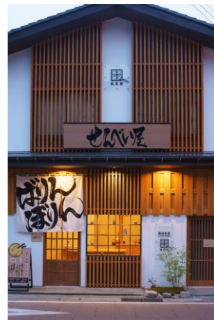
新潟米菓 premium SENBEI 田 DEN

廃業店舗や空き家、空き地が増加し著しく景観を阻害していた温泉街において、若手旅館経営者が自ら出資して合同会社を設立し、民間による店舗リノベーション事業を実施。宿泊客を旅館に囲い込むのではなく、街中に出すことをコンセプトに、温泉街に点在する空き店舗や空き家、空き地を「新潟」をテーマにした体験型店舗等に再生してオープンし、歩いて楽しめる温泉街づくりを進めている。補助金や助成金などを使用せず、自前の資金により1年に1店舗のペースで改修を行う体制ができており、令和5年9月現在は9店舗を経営。11月に10店舗目のオープンを予定している。