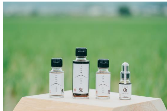
70 年ぶりに復活した天然醸造醤油