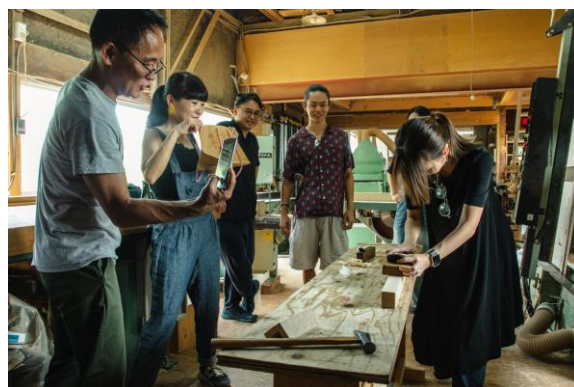
香港・台湾の若手クリエイターによるマテリアルツアー（越前筆筒工房・小柳タンス）