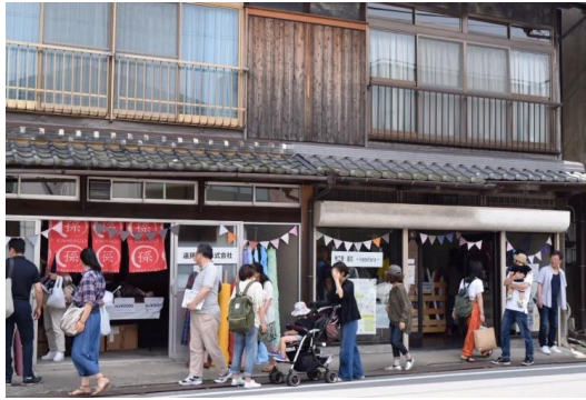
播州織産地博覧会