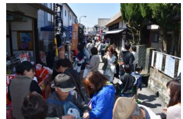
鹿島酒蔵ツーリズム