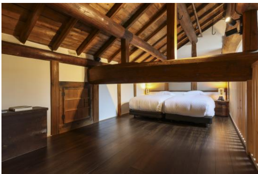
元禄 2 年創業の醤油蔵に泊まる

1689 年創業、奈良最古の醤油蔵「マルト醤油」を復活するため、18 代当主の木村浩幸が醤油造りを 70 年ぶりに復興。約 70 年間、醤油蔵に奇跡的に生き残っていた「菌」を活かした奇跡の醤油とともに、醤油との新たな接点をホテル・レストラン全体で表現。「泊まれる醤油蔵」として、醤油づくりを体感できる宿泊施設に改修し、宿泊客に対し、醤油醸造絞り体験と地域のストーリーを伝えるための朝参り体験を実施している。レストランでは自家栽培した約 150 種類の野菜を使用し、ここでしか味わえない醤油料理を提供している。