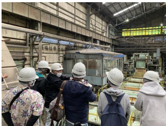
ゆがふ製糖工場見学の様子

※かりゆしウェア＝沖縄県内で正装、ビジネスウェアとして定着している沖縄らしさが表現された県産品のシャツ。