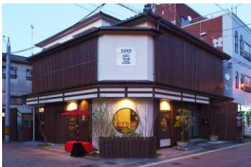
新潟飲物 Premium TASTE 香 外観