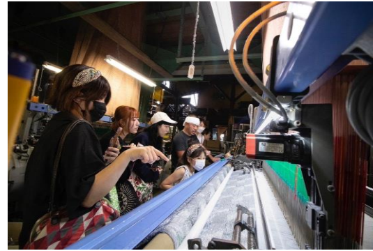
生産現場を公開するオープンファクトリー