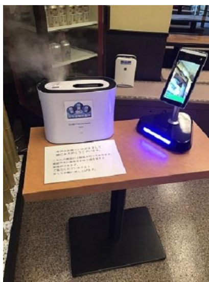
(船内の除菌及び検温を実施)