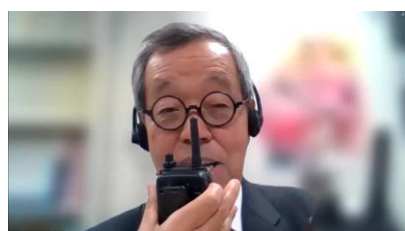
意見・情報交換会（翻訳機実演）