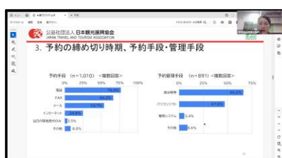
観光ガイド団体調査 結果報告