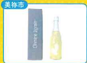
美祿市 美祿の地酒