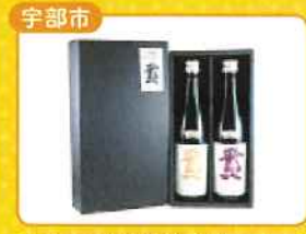
宇部市 宇部の地酒「賁」飲み比べセット