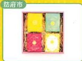
防府市 レモンティー詰め合わせセット