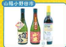
山陽小野田市 山陽小野田のお酒飲み比べセット