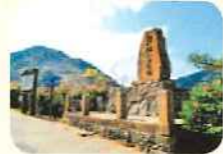
源松跡・吉田松陰歌碑