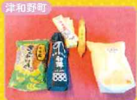
津和野町 津和野町特産品詰め合わせセット