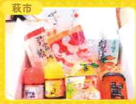
萩市 萩散歩満喫セット