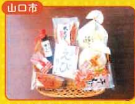
山口市 山口・秋穂のえび三昧セット

計7個のスタンプを 集めた方から抽選で7名様に 5,000円相当の 特産品+山口県立山口博物館 「江戸時代の旅と街道」展の 図録をプレゼント!