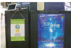
ツーリズムEXPOジャパン2018 会場内での展開例(阿智昼神観光局)