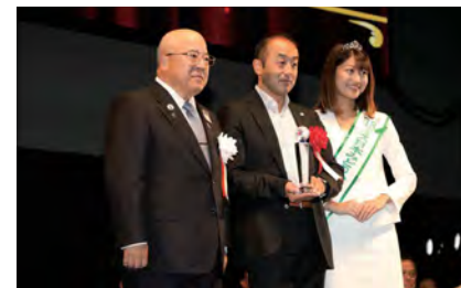
(表彰風景 左:田川ツーリズムEXPOジャパン実行委員長 中央:井口氏 右:ミス日本)