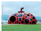
長瀬 隆生「赤かぼちゃ」2006年 広島・宮浦海岸