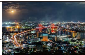
▲高塔山からの夜景

【集合】17:20(北九州国際会議場前 バス乗車) 【募集人数】80名 【所要時間】17:20~19:30(小倉駅解散) 【参加費】無料