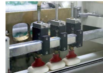
▲シャボン玉石けん

良質な天然油脂を原料に昔ながらの「釜炊き製法」で、人と環境に優しい無添加石けんを製造する環境都市北九州を代表するメーカーがシャボン玉石けんです。また同じ若松地区にある今では他に現存のない「軍艦防波堤」にご案内します。