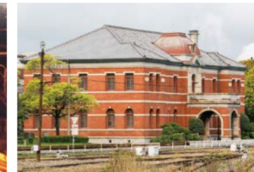
▲官営八幡製鐵所旧本事務所眺望スペース

順路 小倉駅(バス乗車)→日本製鉄九州製鉄所→世界遺産眺望スペース→小倉駅(バス降車)→門司港駅(バス降車)