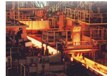
▲日本製鉄九州製鉄所

1901年に操業開始したことで知られている官営八幡製鐵所。現在は、日本製鉄九州製鉄所として、世界をリードする高性能・高品質の鉄鋼製品を製造しており、ダイナミックな鉄の製造工程をご観いただけます。また、構内にある旧本事務所は2015年に世界文化遺産に登録されています。